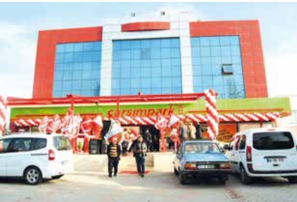
Kozan Çarşımpark Alışveriş Mağazaları

Hep bir arada, sevgi dolu ve huzurlu nice bayramlar geçirmek dileğiyle, Ramazan Bayramı'nız kutlu olsun!